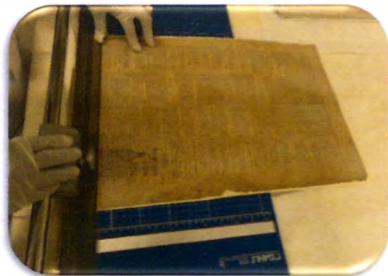
10- Corte de los documentos restaurados