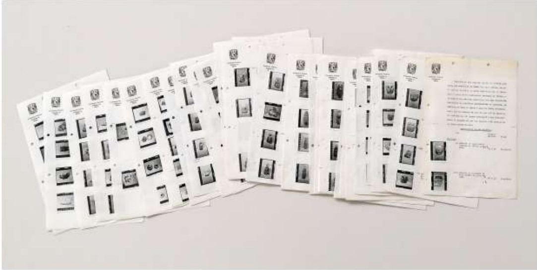
Relación de objetos prestados de la colección del Dr. Milton Arno Leof. Expedientes de Exposiciones. Escultura Precolombina de Guerrero , 1964.