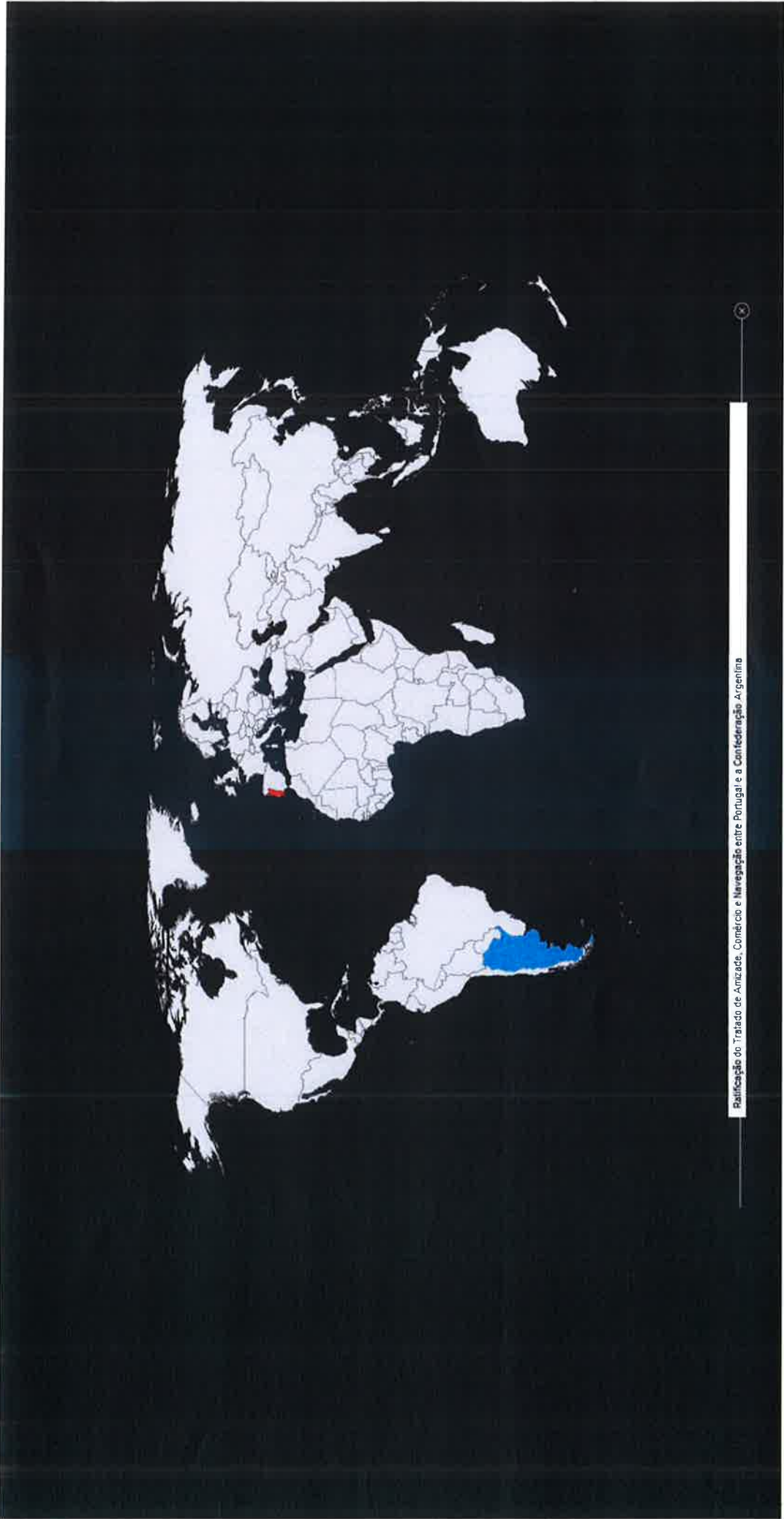
Ratificação do Tratado de Amizade, Comércio e Navegação entre Portugal e a Confederação Argentina