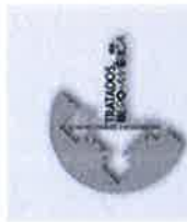
Tratados da Ibero-América