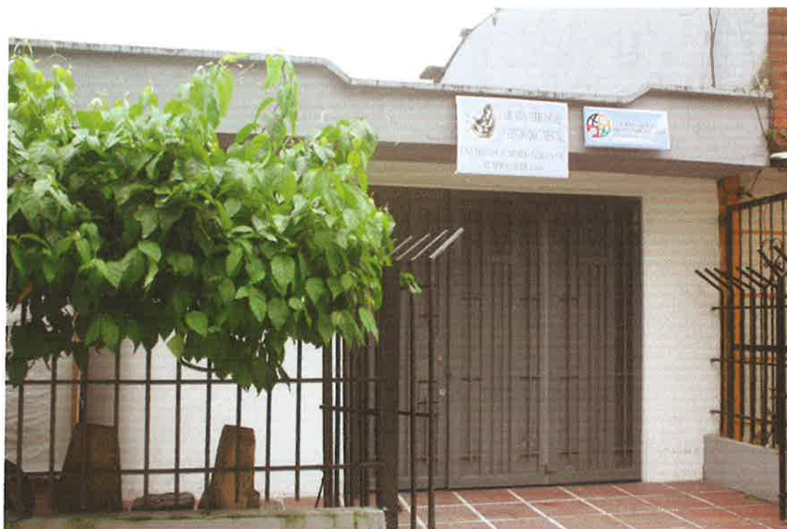
Centro documental parte externa. -

Fotografías tomada en el mes de enero-febrero/ 2009.