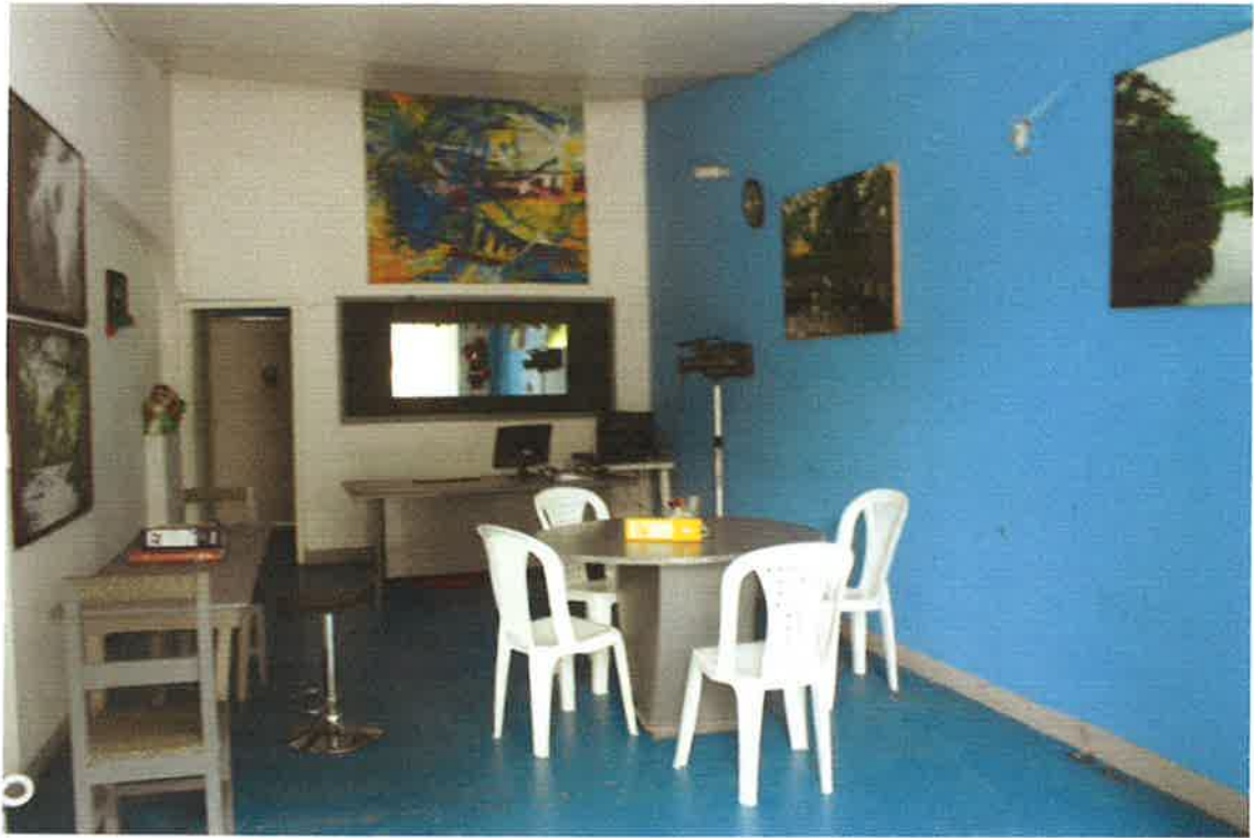
Parte Interna Centro documental