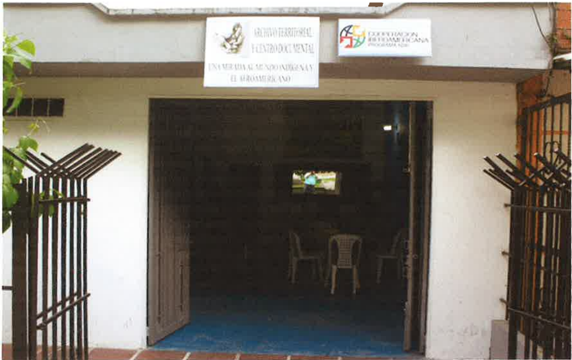
Centro documental parte externa.