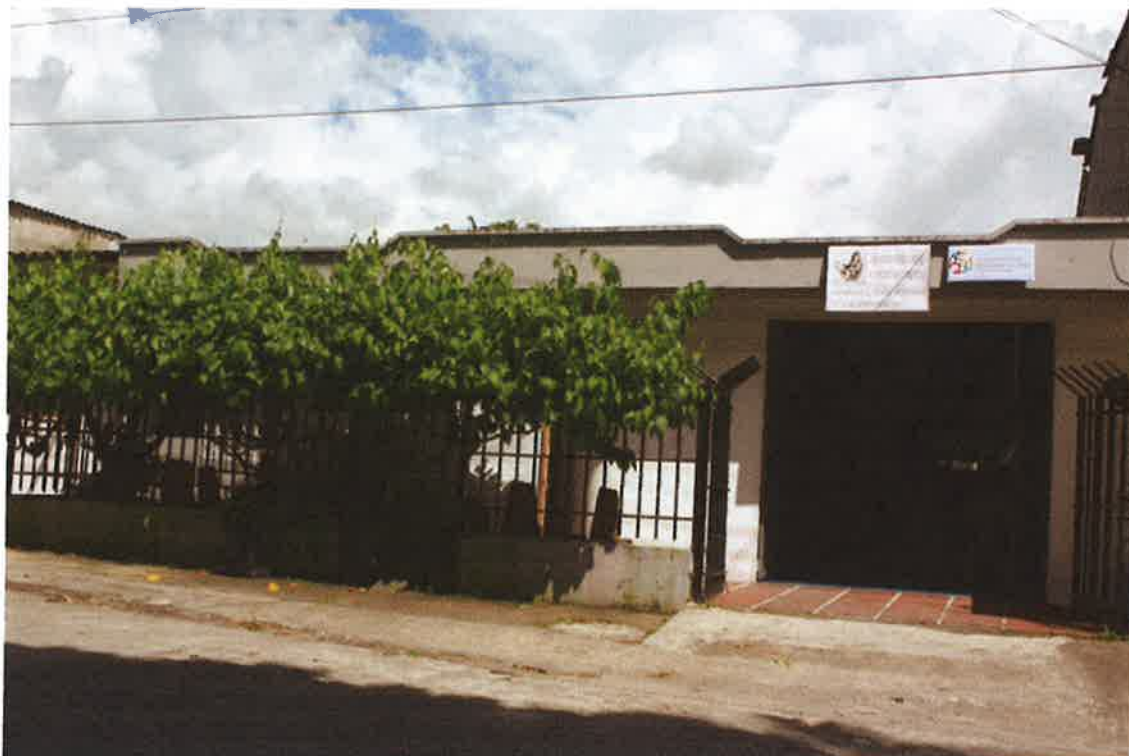
Centro documental parte externa.