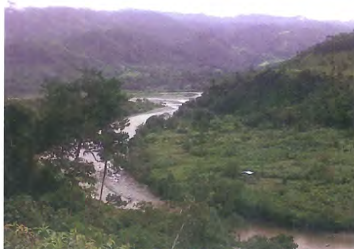
Paisajes del Amazonas Colombiano, Departamento del Putumayo