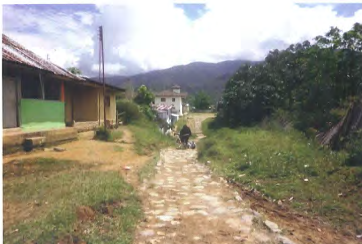
Entrada al Resguardo Yunguillo