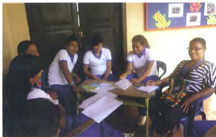
Jóvenes de la Comunidad Indígena INGA, estableciendo un conversatorio para determinar la metodología de clasificación de los archivos, desde los conceptos adquiridos en los talleres.

Las necesidades planteadas por los participantes, permitieron socializar conocimientos básicos en torno a los documentos de archivo, su importancia y la forma en que se deben organizar como preámbulo a la aplicación de un taller de organización de los documentos que existen en el Resguardo Indígena de Yunguillo.