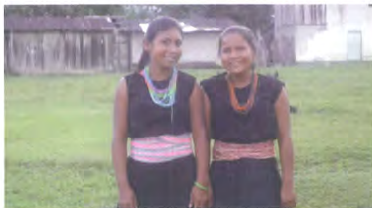
Jóvenes indígenas utilizando las prendas típicas utilizadas por las mujeres de la Comunidad. Los collares y cinturones son elaboradas por las jóvenes y es una de las tradiciones que se mantiene en la Comunidad.

En esta actividad se reviso los archivos que ellos tienen en la institución educativa de la Comunidad, lugar en donde reposan fondos documentales.