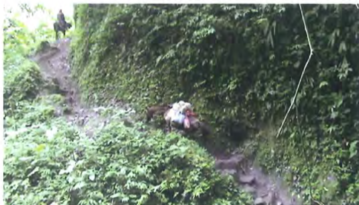
Camino de herradura, que conduce al Resguardo Indígena de Yunguillo

El Resguardo Indígena de Yunguillo se encuentra localizado a 76°26' longitud Oeste y a 1° 20' latitud norte, sobre la margen occidental del río Caquetá en su cuenca alta, en el Piedemonte Amazónico de los Andes del sur de Colombia, la población de Yunguillo se encuentra a unos 30 kilómetros de la Ciudad de Mocoa, capital del Departamento de Putumayo, al resguardo se llega por carretera, por la vía Pitalito, tomando el cruce del camino Condagua-Yunguillo, el camino es apto para transporte de vehículo aproximadamente 12 kilómetros, después el camino solo permite el tránsito de personas y animales por un estrecho sendero, que se extiende aproximadamente por 6 kilómetros, hasta llegar al Resguardo de Yunguillo.