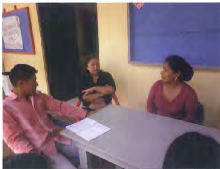
Representantes de la Comunidad analizando los temas de archivo y su impacto en la salvaguarda de la cultura indígena

Para el desarrollo del proyecto y en concordancia con los objetivos del proyecto durante la visita realizada en el mes de abril de 2012 se llevaron a cabo las siguientes actividades.