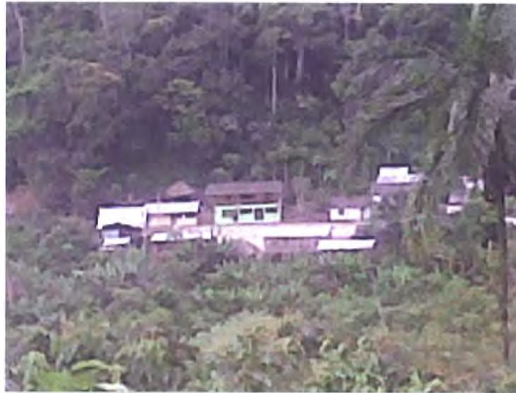
1. Vista del Resguardo desde el Camino de Herradura

Estos quechuas estaban asentados en el extremo norte (Chinch) de los límites del Imperio. Al dividirse éste en 1527, entre los seguidores de Huáscar y Atahualpa, comenzó un período de aislamiento para ellos, que se agudizó al producirse la destrucción del Imperio en 1533 y la invasión española de la región en 1538. A partir de ahí se conforma el pueblo inga, que a más de compartir el Sibundoy y Mocoa con los camsá, se extendió hacia el territorio andaquí, en el Caquetá, norte de Putumayo y suroriente del Cauca y luego estableció varios asentamientos en el extremo noroccidental de la Amazonia .