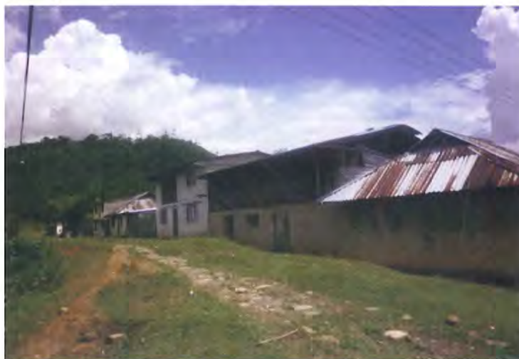
Viviendas Indígenas del Resguardo Yunguillo

El Resguardo Indígena de Yunguillo se encuentra localizado a 76°26' longitud Oeste y a 1° 20' latitud norte, sobre la margen occidental del río Caquetá en su cuenca alta, en el Piedemonte Amazónico de los Andes del sur de Colombia, la población de Yunguillo se encuentra a unos 30 kilómetros de la Ciudad de Mocoa, capital del Departamento de Putumayo, al resguardo se llega por carretera, por la vía Pitalito, tomando el cruce del camino Condagua-Yunguillo, el camino es apto para transporte de vehículo aproximadamente 12 kilómetros, después el camino solo permite el tránsito de personas y animales por un estrecho sendero, que se extiende aproximadamente por 6 kilómetros, hasta llegar al Resguardo de Yunguillo.