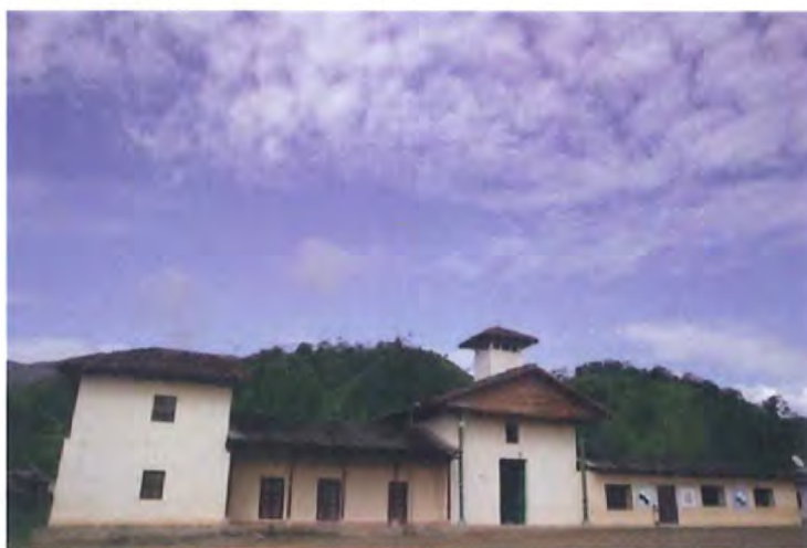
Iglesia y Escuela del Resguardo Indígena de Yunguillo.