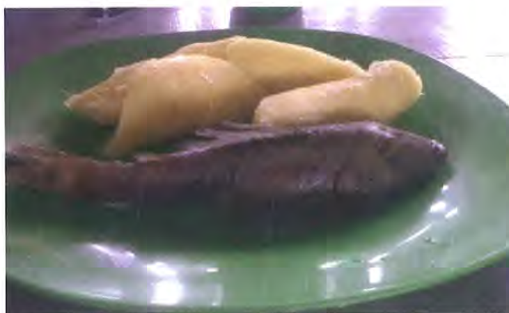
Platos típicos de la Comunidad Inga

Descienden de la población instalada por el inca Huayna Cápac en Mocoa y el valle de Sibundoy (Putumayo), en 1492 tras someter a los Camsá. Se trataba básicamente de mitimak-kuna o comunidades militares agrícolas y de mercaderes dedicados al comercio exterior y la recopilación de información, unos y otros al servicio del Imperio inca.