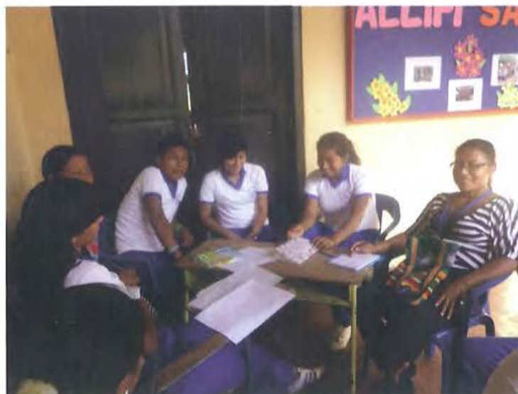
Grupo de estudiantes indígenas realizando las actividades de los talleres