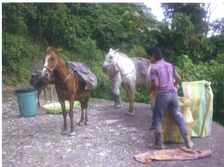
El único medio con el que se puede contar para llevar las provisiones y demás son animales de carga.