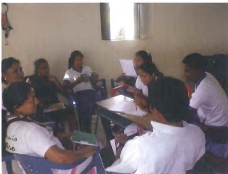
Grupo de estudiantes indígenas realizando las actividades de los talleres