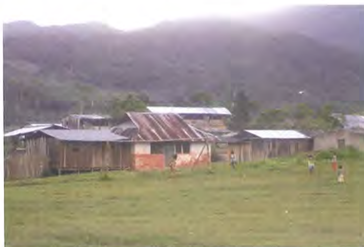
Viviendas Indígenas del Resguardo Yunguillo

Para el trabajo realizado en la ejecución del proyecto se trabajó y se realizaron las actividades en el asentamiento de Yunguillo, ubicado en el departamento del Putumayo, cerca a Mocoa.