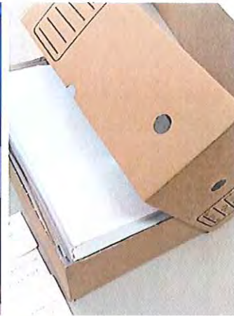
Fotografia 8: reacondicionamento dos processos em caixas.