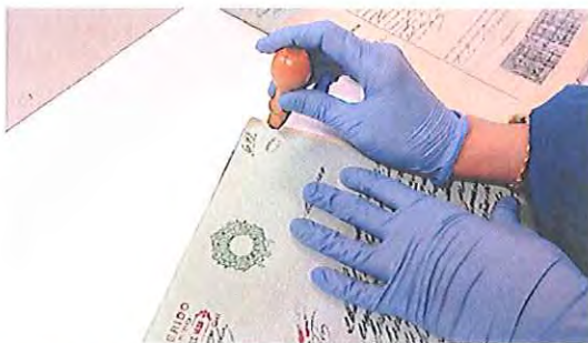
Fotografia 9: operação de carimbagem.

Valores totais: 120.000 processos carimbados e colocada a cota topográfica.