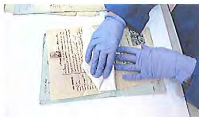
Fotografia 4: higienização de poeiras soltas.