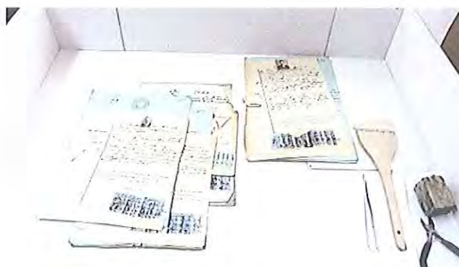
Fotografia 1: aspecto geral dos processos antes da higienização.

Valores totais: 120.000 processos higienizados, correspondendo a 600.000 documentos.