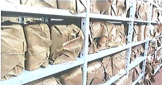
Fotografia 14: armazenamento dos documentos antes do tratamento.

Valores totais: 1.200 caixas reinstaladas.