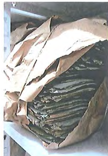
Fotografia 6: acondicionamento dos processos antes das intervenções.

Valores totais: 120.000 processos reacondicionados em 1.200 caixas.