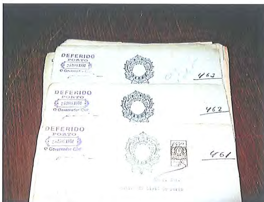
Fotografia 17: ordenação numérica dos processos.

Procedeu-se igualmente à ordenação dos processos, por ordem numérica de registo.