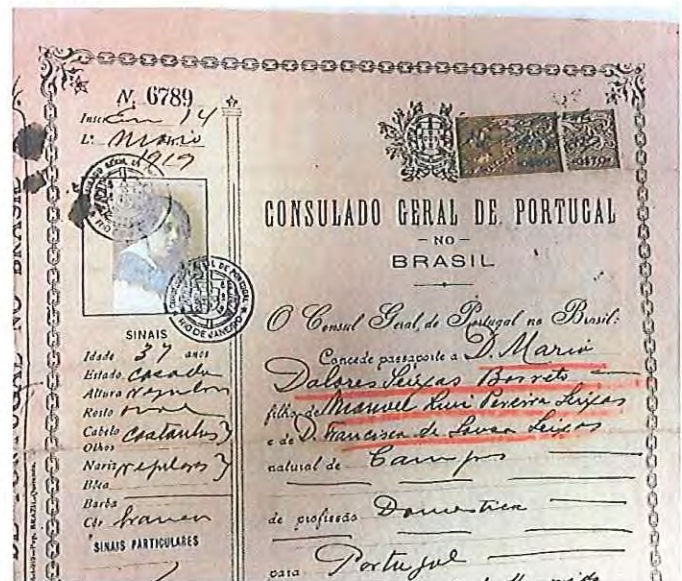
Fotografia 13: pormenor do documento tratado.

Valores totais: 167 processos intervencionados, correspondendo a 835 documentos.