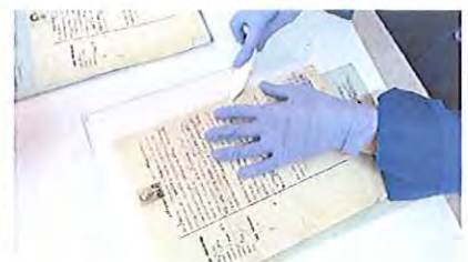
Fotografia 5: planificação pontual.