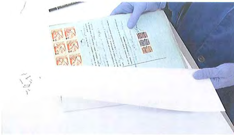
Fotografia 7: reacondicionamento dos processos em capilhas.