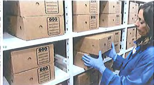
Fotografia 15: armazenamento dos documentos após o tratamento.