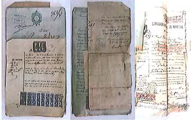
Fotografia 11: aspecto geral (frente e verso) de um processo antes da intervenção.

materiais com “qualidade de arquivo” mencionados na candidatura.