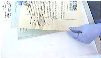
Fotografia 3: desdobra do 1º fólio (de cada processo).