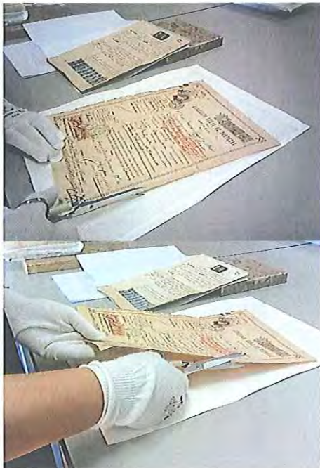
Fotografia 12: intervenções durante o tratamento do processo.