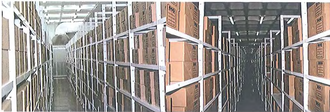
Fotografia 19: aspecto final da documentação tratada em depósito.