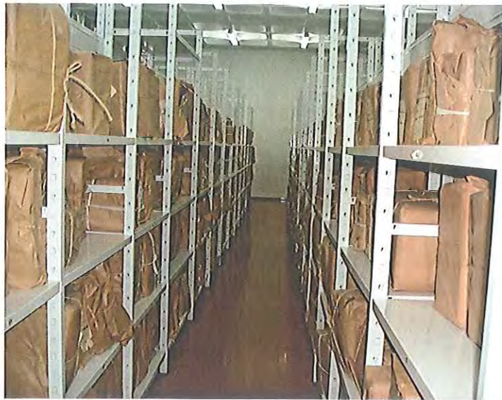
Fotografia 18: aspecto inicial da documentação em depósito.