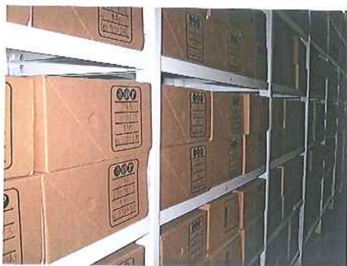
Fotografia 20: aspeto final da documentação tratada.

A descrição técnica e a avaliação e controlo da qualidade das descrições dos livros de registo de passaportes e dos processos resultaram num total de 53.364 processos correspondendo a 430 unidades de instalação descritas.