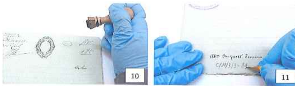
Fotografia 10: carimbagem dos processos. Fotografia 11: colocação de cotas topográficas nos processos.