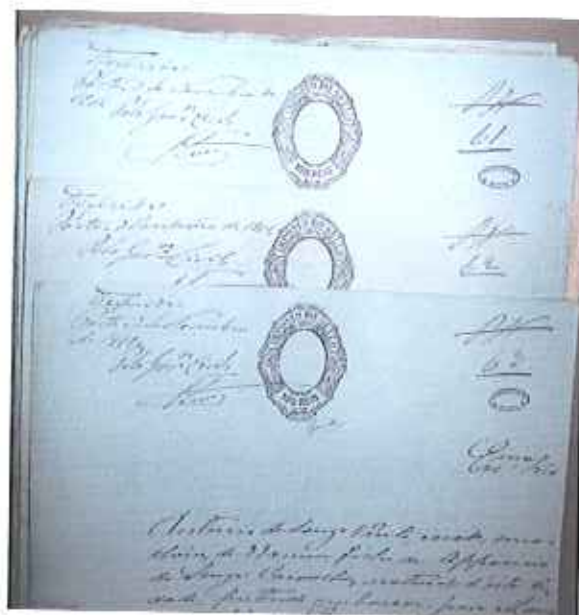
Fotografia 19: ordenação numérica dos processos.

A descrição técnica e a avaliação e controlo da qualidade das descrições dos livros de registo de passaportes e dos processos resultaram num total de 53.364 processos correspondendo a 430 unidades de instalação descritas.