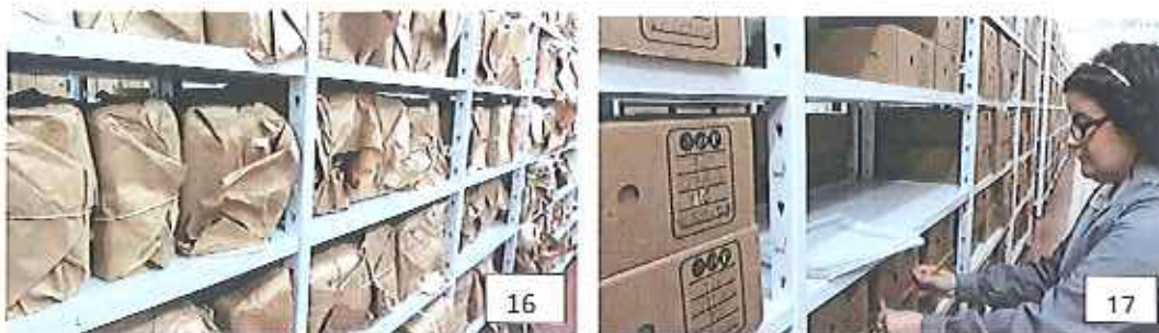
Fotografias 16 e 17: armazenamento dos documentos antes e após a instalação.

Valores totais: 430 caixas reinstaladas.