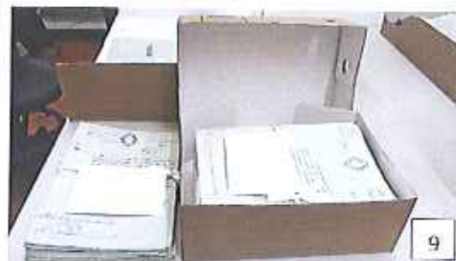
Fotografia 7: acondicionamento dos processos antes das intervenções. Fotografias 8 e 9: reacondicionamento dos processos após as intervenções.