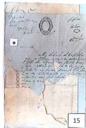
Fotografia 12: planificação de documentos danificados. Fotografias 13, 14 e 15: tratamento de um processo antes, durante e após as intervenções de conservação curativa.