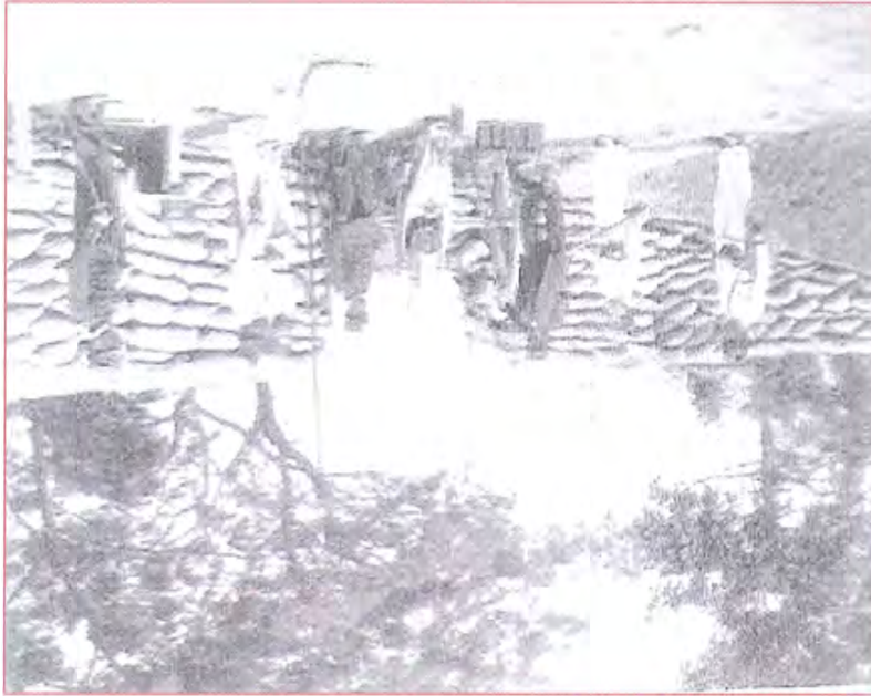
Juan Gutierrez – A Revolta da Armada – Fortificação Passageira, 1894

Foi elaborado em seguida um roteiro para a confecção de matriz de CDROM, onde foram incluídos textos sobre o Museu Histórico Nacional; o Arquivo Histórico; breve histórico sobre a fotografia e a Coleção Juan Gutierrez, incluindo nesse último item dados sobre o artista. Concluído o roteiro, foram contratados trabalhos de versão para o espanhol e o inglês.