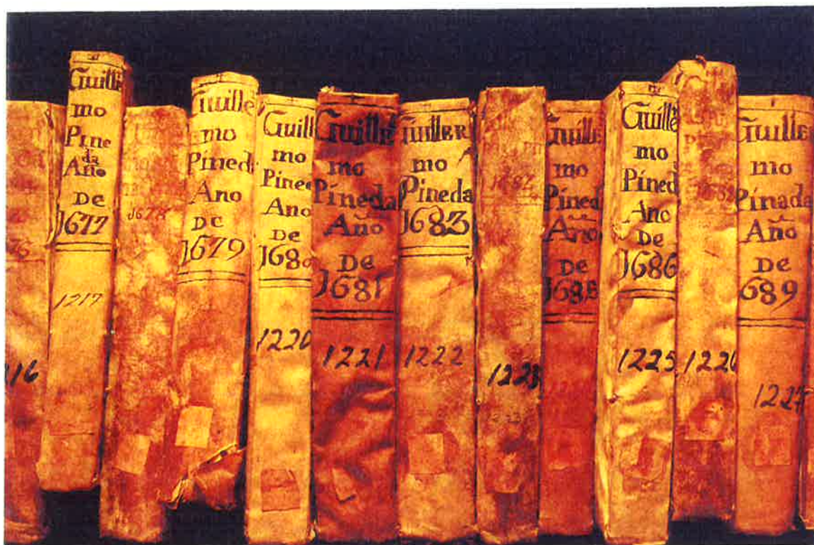
(Fotografía No. 3)