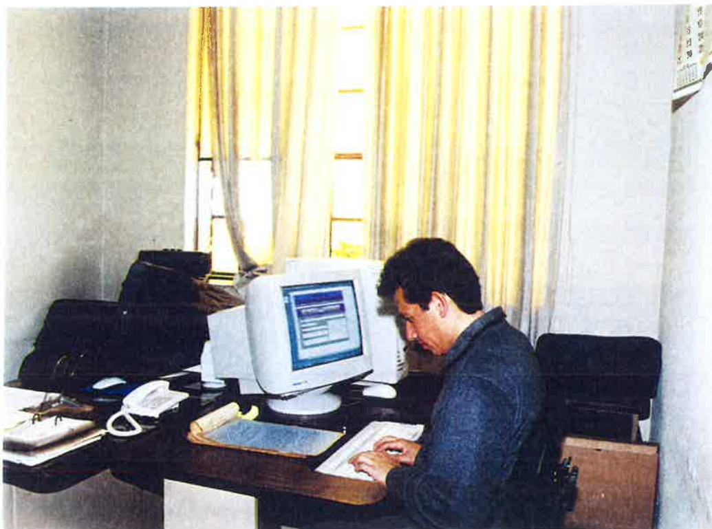
(Fotografía No. 2)