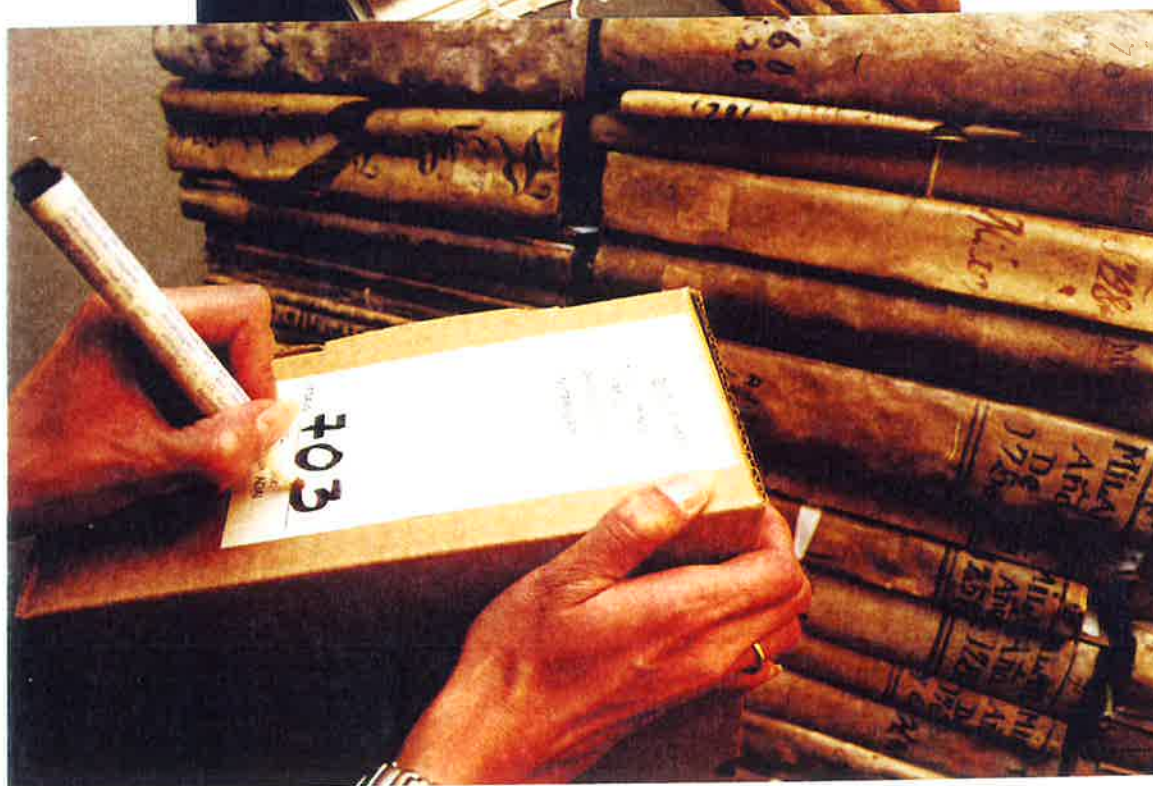
(Fotografías No. 6 y 7)