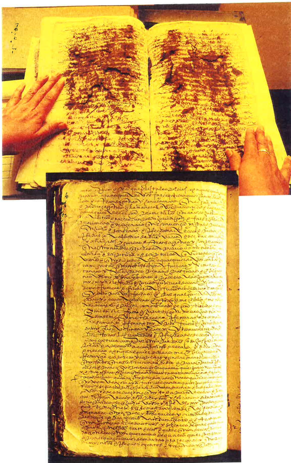
(Fotografías No. 8 y 9)