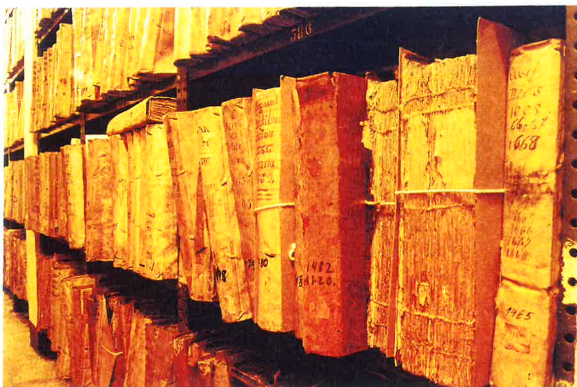
(Fotografía No. 4)